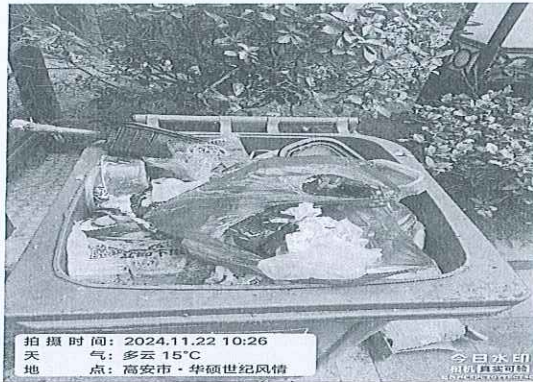
附图：垃圾桶满溢，且未分类