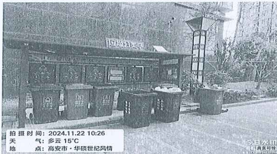
附图：垃圾桶未在规定位置摆放