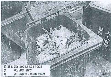
附图：树叶易腐蚀（厨余垃圾）未分类在厨余垃圾桶