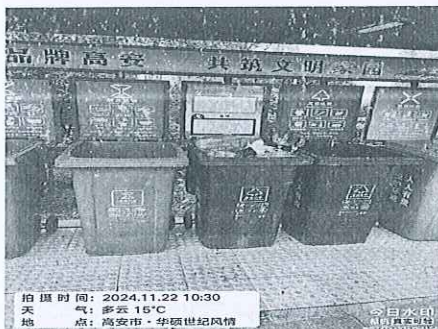
附图：垃圾桶未套袋